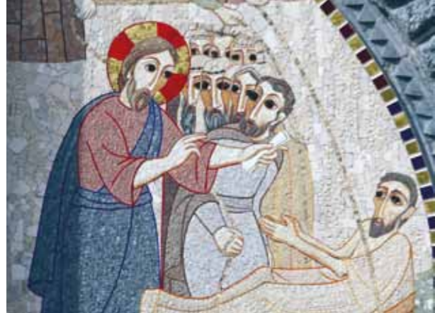
Jezus verschijnt aan de leerlingen. Mozaïek van M. Rupnik, basiliek Notre-Dame du Rosaire in Lourdes