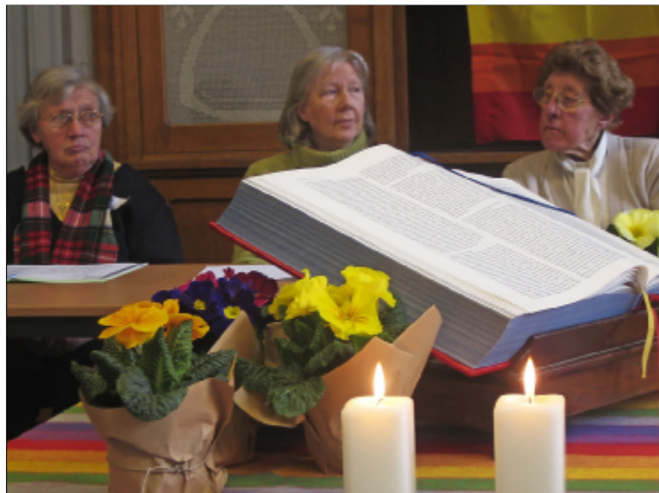
Deelnemers aan de School voor Geloofsverdieping wisselen inzichten over hun geloofsleven uit.

Vandaag ziet het maatschappelijke veld (ik ging bijna 'slagveld' schrijven) er volledig anders uit. Er is een zekere onverschilligheid omtrent godsdienst, parochie en eucharistie ingetreden. De parochie en haar kerkplekken behoren tot de vele uitdagingen waarmee kerk en geloof op vandaag geconfronteerd worden. Natuurlijk bestaat er een verschil tussen de parochie op het platteland en in de stad. De kerkplek is nochtans een plek om kerk, om gemeenschap te vormen. En op het platteland staan de gelovigen nog steeds dicht bij de kerk en de parochie dan in de stad waar de secularisatie-druk evidentier en groter is, terwijl de anonimiteit in de samenleving eveneens ruimer verspreid is. Waar