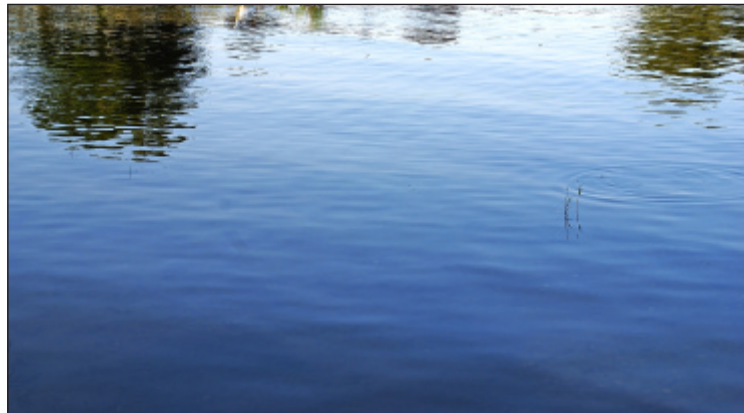
Meer van Galilea

Een broeder wilde naar het Jeta- vana, de plaats waar boeddhisti- sche monniken bijeenkomen. 's Avonds kwam hij aan bij de oever van de rivier Aciravati. De schip- per had zijn boot al op de oever getrokken om naar de prediking te gaan luisteren. Omdat de broe- der geen boot zag om over te va- ren, ging hij, vol blijde gedachten aan Boeddha, op het water van de rivier. Zijn voeten zonken niet in het water: hij ging als op vaste grond. Maar toen hij in het mid- den van de rivier de golven zag, werden zijn blijde gedachten aan Boeddha zwakker en begonnen zijn voeten te zinken in het water. Hij dacht opnieuw vol vreugde aan Boeddha en ging verder op het water. Zo kwam hij in het Jetavana. Hij groette de meester en zette zich naast hem neer. De Meester sprak hem vriendelijk aan en vroeg: 'Beste broeder, niet te veel moeilijkheden gehad om naar hier te komen?' De broeder antwoordde: 'Heer, omdat ik vol blijdschap aan Boeddha dacht, ging ik op het water alsof ik op vaste grond ging.' Toen zei de Meester: 'Broeder, jij bent niet de enige die een vaste grond vond, door te denken aan de eigen- schappen van de Boeddha, ook vroeger vonden broeders vaste grond te midden van de oceaan, toen hun boot vernield was, door aan de goede eigenschappen van de Boeddha te denken.' (Uit de Dzjataka, verhalen en fabels over Boeddha)