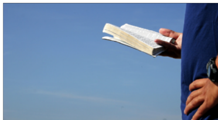
De Bijbel als het woord van God.